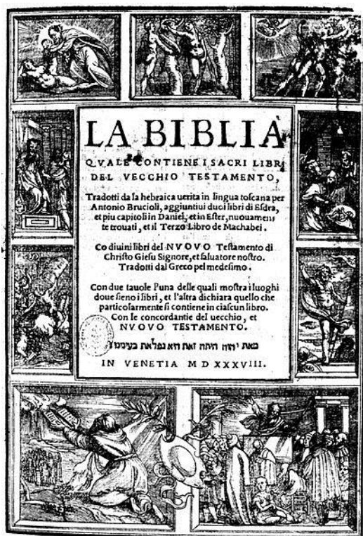
Figura 2: Frontespizio della Bibbia in traduzione del Brucioli, Venezia 1538.

Tutti questi testi, smerciati da Gadaldino erano importati illegalmente soprattutto da Venezia, dalla Francia e da Ginevra. Anche in questo caso, si sfruttava l'attività artigianale, nascondendo libri dentro le balle di lana per superare i controlli. I gruppi si riunivano per leggere, discutere di fede o celebrare veri e propri culti con la distribuzione del pane e del vino nascosti nelle botteghe, nelle case private o, al contrario, magari uscivano fuori dalle mura in aperta campagna.