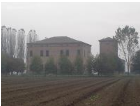
Figura 3: Palazzo Giusti, presso San Prospero di Modena, in passato proprietà dei Castelvetro, dove nel 1823 furono rinvenuti i libri nascosti da Ludovico. Questa foto risale all'inverno del 2010. Nei primi mesi del 2013, la villa appariva dalla strada pubblica non accessibile e con i tetti ricoperti, per cui ne ho dedotto che possa aver subito danni negli eventi sismici del maggio 2012, ma non essendo riuscita a parlare con i proprietari, non ho alcuna notizia ufficiale al riguardo.

Nella villa una volta proprietà dei Castelvetro, che si trova in campagna a San Prospero di Modena, nel 1823, durante i lavori di ristrutturazione nel cavo di un muro della torre, furono ritrovati parecchie carte e sessanta volumi, testi classici della Riforma, da Calvino a Zwingli, da Lutero a Melantone, Erasmo, Bucero, etc. Le carte furono bruciate dall'arciprete di Finale Emilia, perché «eretiche». I libri furono consegnati alla Biblioteca Estense di Modena. Poi però si persero nei suoi meandri. All'inizio del '900, lo storico Cavazzuti, biografo di Castelvetro, riuscì a ritrovare la lista esatta dei libri, a identificarne uno con sicurezza e un altro paio con qualche margine di dubbio. Si pensa che Castelvetro abbia nascosto lì questi scritti prima di fuggire all'estero, magari nella speranza di riuscire prima o poi a recuperarli. Al di là della curiosità storica, appunto, questa lista di libri fornisce un'indicazione ulteriore di come il movimento eterodosso modenese potesse conoscere molti testi della teologia riformata e ci conferma l'attività di Castelvetro come traduttore. Oltre infatti al già citato «De ecclesiae auctoritate», la cui traduzione è di attribuzione certa, si pensa che possa essere anche l'autore della traduzione dei «Loci Communes», sempre di Melantone.